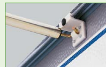
Vario Clip-Elemente bieten Gebrauchskomfort und Sicherheit, lästiges Schrauben entfällt! Der spezielle Dachkeder ist serienmäßig vorgerüstet.

Hinweis: Bei unklarer Wetterlage, Schneefall, Regen und Wind empfehlen wir, das Sonnendach abzubauen – für Ihre eigene Sicherheit und für die Ihrer Platznachbarn.