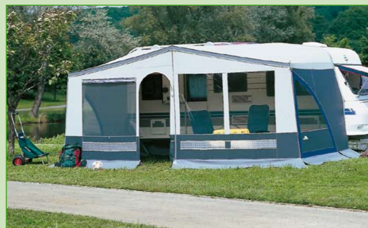
Sie können sogar eine Vorderwand mit Folienfenster oder ‚Fresh‘ mit Moskitogaze und Fensterklappe vorbauen. Die Befestigung erfolgt ringsum mit Reißverschluss. Diese Variante ist nur mit einem Basisgestänge möglich!