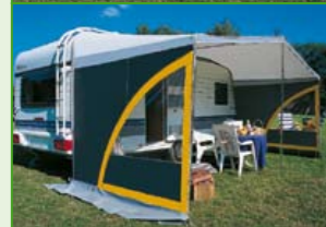
In der Ausführung ‚Fresh‘ sind die Seitenwände mit Moskitogaze-Einsatz und Fensterklappe ausgestattet, die vor Zugluft und Sonneneinstrahlung schützt.