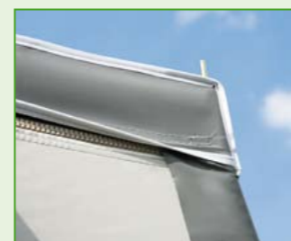
Dach, Seiten- und Vorderwände sind über die gesamte Breite fest verbunden – im Vergleich zu herkömmlichen punktuellen Clip-Verbindungen ein deutliches Plus an Stabilität!