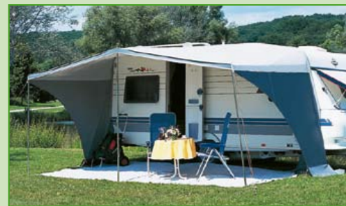
Das Basismodul Flair Vario Modul ist ein attraktives Sonnendach!

Und schließlich können Sie das Ganze sogar mit einer teilbaren Vorderwand ausstatten, die über Reißverschlüsse mit dem Sonnendach verbunden wird!