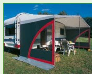
Seitenwände zum Nachrüsten gibt es in der Ausführung ‚Color‘ in Rot, Gelb und Blau mit großem Folienfenster.