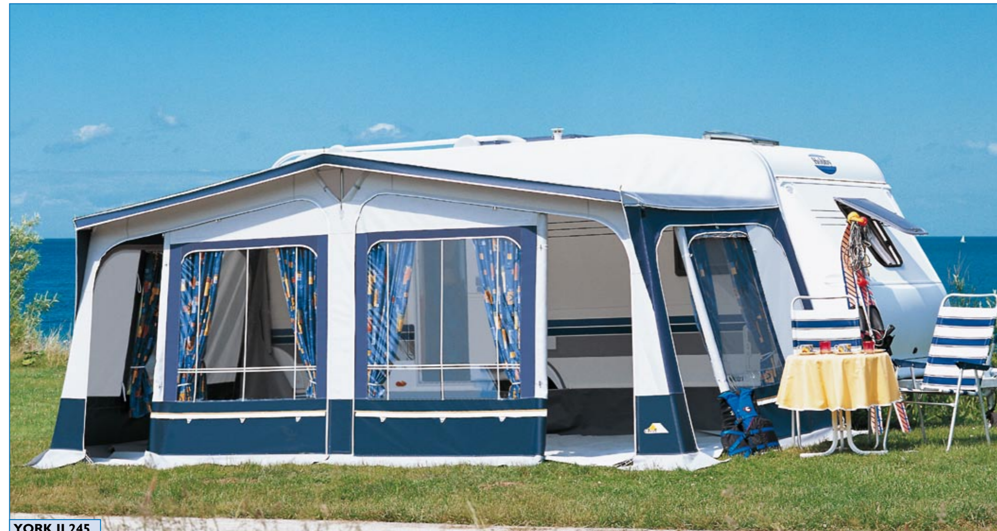
YORK II 245