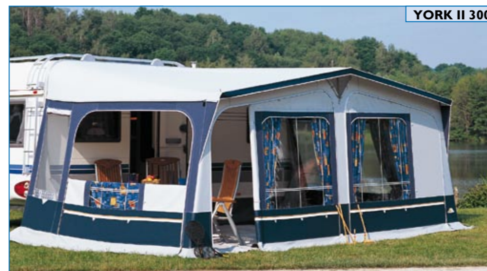
YORK II 300

Extra viel Platz: Mit einer Großraumtiefe von 300 cm bietet York II 300 viel Bewegungsspielraum für jedes Familienmitglied!