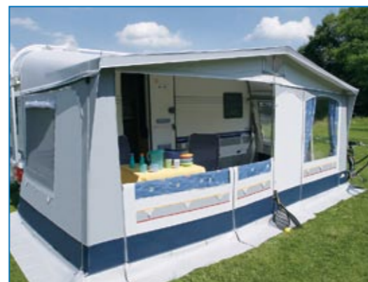
Angenehm: Rollen Sie die Vorderwand ganz oder teilweise herunter und Sie haben eine Veranda! Hohlsäule für die entsprechenden Stangen sind bereits eingenäht.