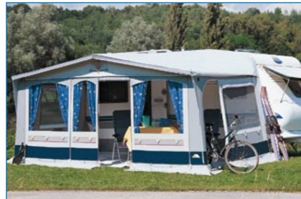
Das Vorderwand-Türsegment können Sie rechts (oben) oder links (großes Bild unten) von der Mitte platzieren – ganz nach Wunsch.