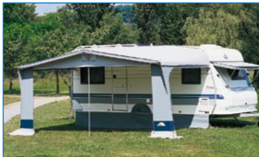
Für schnellen, bequemen Aufbau lassen sich Vorder- und Seitenwände herausnehmen.

Ein durchdachtes Konzept in klassisch-elegantern Design – das sind die Pluspunkte von Lord! Dank der austauschbaren Elemente können Sie die Zelt-Vorderwand je nach Standort und Anforderungen individuell gestalten. Und mit seinem strapazierfähigen Material und seiner erstklassigen Verarbeitung wird Sie dieses Modell ohnehin überzeugen – beim Reise- wie beim Saisoncamping!