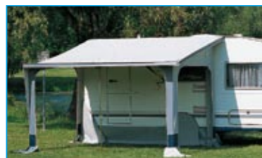
Nehmen Sie die Vorder- und Seitenwände heraus, und Sie haben ein schattiges Plätzchen unter Ihrem Sonnendach!

Wenn Sie auf Tour sind, schließen Sie die Fensterklappen. So haben Hitze und unerwünschte Blicke keine Chance!