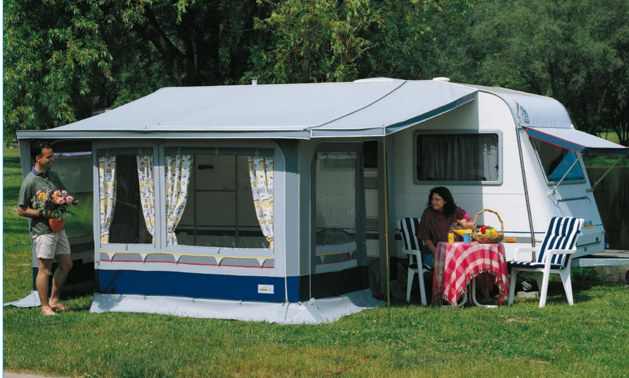
Das abgebildete Verandadach ist ein Extra und separat zu bestellen.

Sie fahren einen großen Caravan und wünschen sich sowohl den Luxus eines Vorzeltes wie auch eine windgeschützte Freifläche vor dem Fahrzeug? Dann ist Brillant genau richtig! Dank der hervorragenden Qualität und umfangreichen Ausstattung sind Sie für jede Jahreszeit bestens gerüstet. Genießen Sie Reisen und Dauercamping mit diesem eleganten Pultdachzelt!