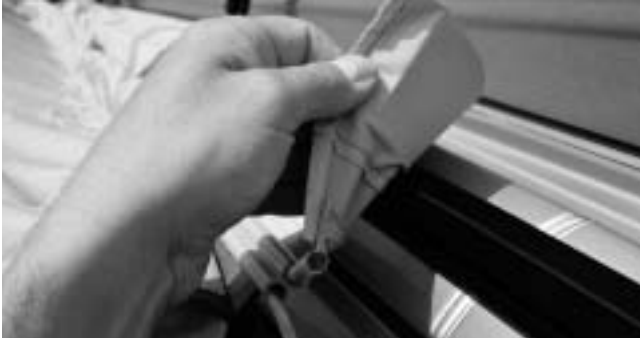
4. Sonderausstattung / special equipment: Magnetadapter / magnetic adaptor