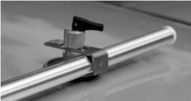
5. Sonderausstattung / special equipment: mit Klappsauger und Klemmstange/ with sucker and connection pole