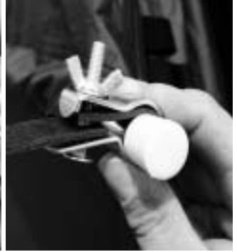
1. Standardzubehör / standard equipment Equipment Klemmstange für Regenrinne mit Klemmschelle Connection pole with Clamp for raingutter