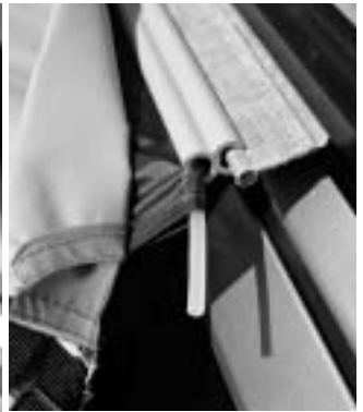
3. Sonderausstattung / special equipment: Kederadapterset / cord adaptor