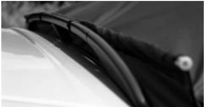
2. Standardzubehör / standard equipment mit Klettband an der Dachreihing/ with hook and loop tape at the top rail